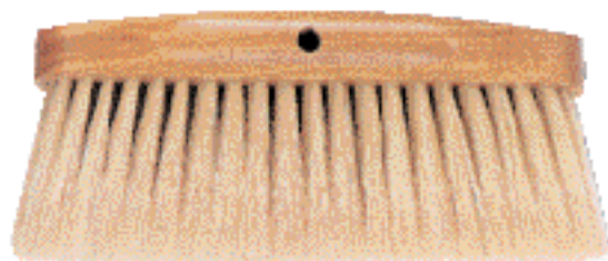
Brosses pour patine 1110 PL

Il est très utile, voire indispensable d'avoir sous la main les accessoires suivants :