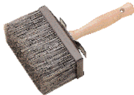
Brosses en soie de Chine grise, réf 664